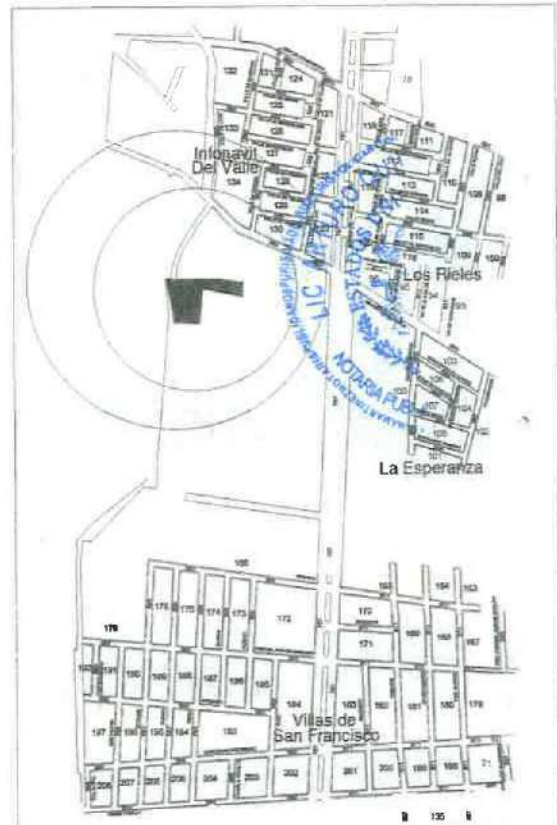
CROQUIS DE UBICACIÓN