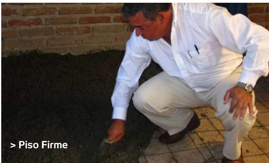
> Piso Firme