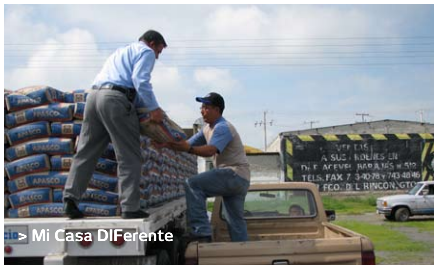
> Mi Casa DIFerente