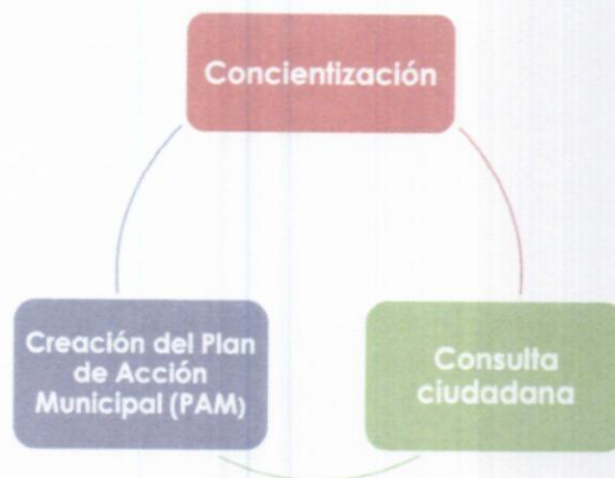
Ilustración 1. Metodología