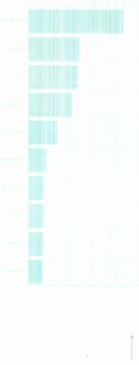
Top 10 incidentes procedentes por Colonia