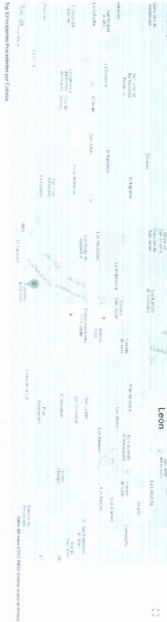
Top 10 incidentes procedentes por Colonia