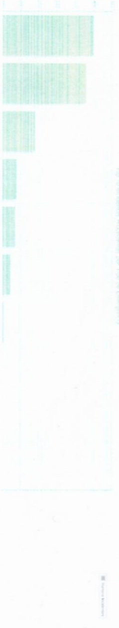
Top 10 incidentes por Tipo de Emergencia