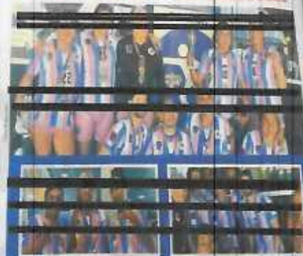
Los deportistas representaron a Purísima en torneo de Fútbol en Estados Unidos.

Los jugadores representaron a Purísima del Rincón en un torneo de Fútbol en Estados Unidos. Los jugadores representaron a Purísima del Rincón en un torneo de Fútbol en Estados Unidos. Los jugadores representaron a Purísima del Rincón en un torneo de Fútbol en Estados Unidos.